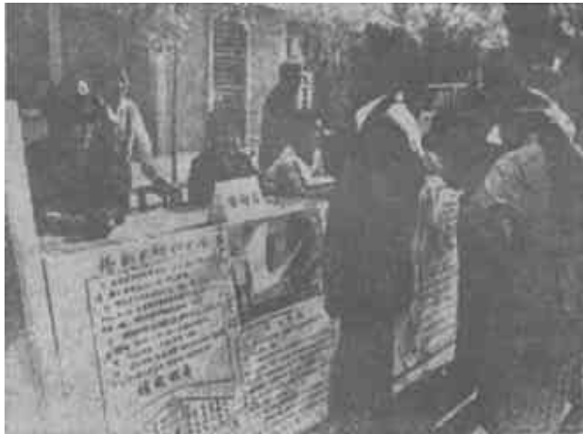
5月17日是世界电信日。市邮电局组织电信业务咨询服务队，向群众宣传新开办的10余种电信业务。图为过路行人正在使用无线电话同对方讲话。

张万湖副市长还就如何在5月中下旬组织一次全市性的计划生育集中活动作了部署。提出要把这个活动的重点放在杜绝多胎生育和最大限度地减少计划外生育上，以推动我市今年人口计划的完成。（本报记者）