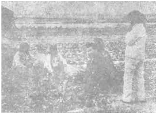
广饶县大王镇注重蔬菜基地建设，今年全镇种植蔬菜一万亩。这是在该镇菜园，一户农民的菜地里，买主和卖主虽然正在讨价还价，但他们望着长势喜人的蔬菜，高兴之情溢于言表。 (黄利平 摄)

垦利县劳动局积极开展对乡镇企业特种作业人员的安全生产培训。今年以来，已举办电工、焊工技术培训两期，200名参加了培训的乡镇企业职工经严格考核合格，领取了《合格证书》，安全技术素质得到了较大提高。 (侯永强)